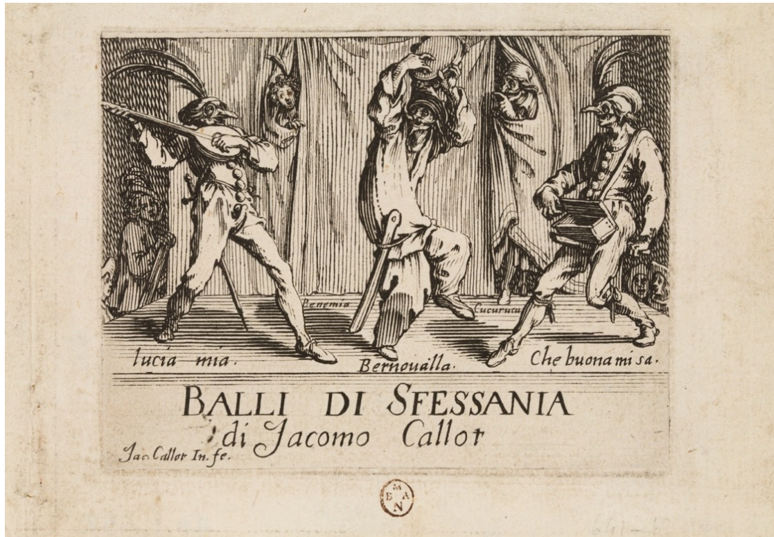
Jacques Callot (1592 - 1635) Frontispice de la série des Balli di sfessania - Eau-forte rehaussée au burin Inv.40.1.357 Nancy, musée des Beaux-Arts