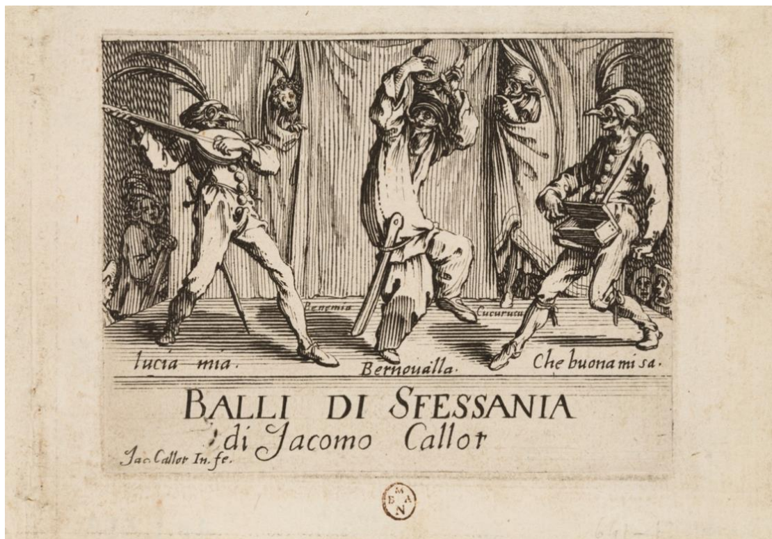
Jacques Callot (1592 - 1635) Frontispice de la série des Balli di sfessania - Eau-forte rehaussée au burin Inv.40.1.357 Nancy, musée des Beaux-Arts